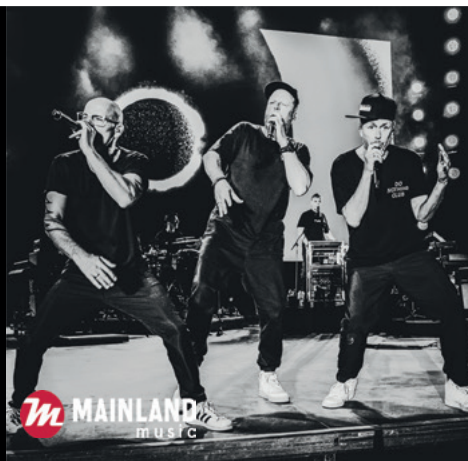
Die Fantastischen Vier 27.05.2022 Hallenstadion Zürich