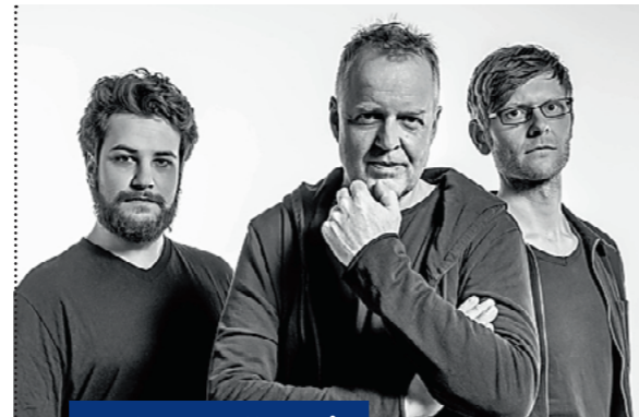
Wolfgang Haffner Trio