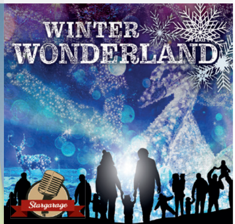
Winter Wonderland Ab November 2021 Bern und Luzern