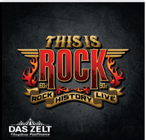
This is Rock 30.12.2021- 14.04.2022 Diverse Orte