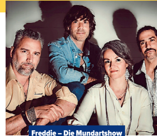
Freddie – Die Mundartshow