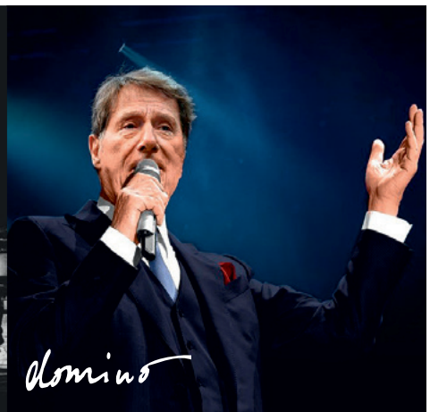
Die Udo Jürgens Story 04.- 11.11.2021 Diverse Orte