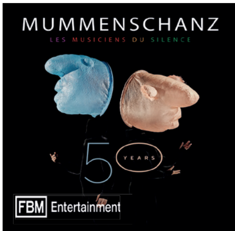
Mummenschanz 10.- 19.12.2021 / 10.- 15.05.2022 Zürich/Basel