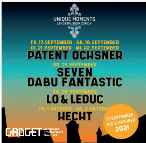
Unique Moments 17.09.- 02.10.2021 Landesmuseum Zürich