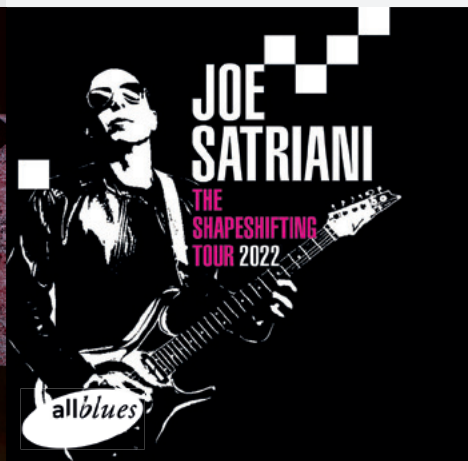
Joe Satriani 20.04.2022 Volkshaus Zürich