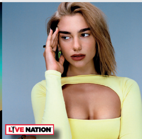
Dua Lipa 20.05.2022 Hallenstadion Zürich