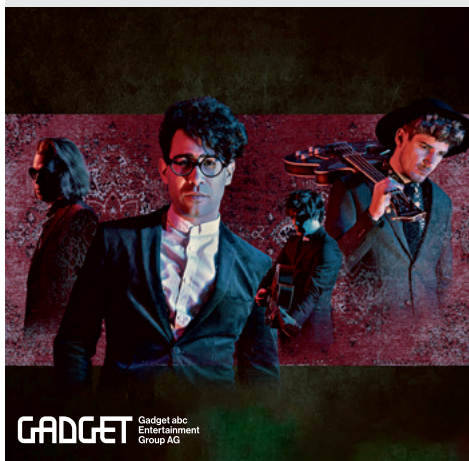
Pegasus 01.10.2021 Hallenstadion Zürich