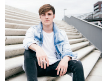
Tom Gregory: Der Brite kommt ans Heitere.