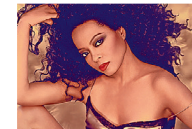
In den 60s mit den Supremes, in den 70ern mit Disco: Diana Ross war immer vorn dabei – nach Montreux kommt sie erst jetzt. (9.7.2022)

«Konzeptuelle Herausforderungen, Technologie und Primitivismus» – Björk bietet Verspieltes für Intellektuelle und erfindet sich dabei permanent neu – und immer auch auf der optischen Ebene. Nach 24 Jahren Montreux-Abstinenz kehrt die zugleich bekannteste und kreativste Isländerin nach Montreux zurück – und wird dort von einem ganzen Symphonieorchester begleitet. (3.7.2022)