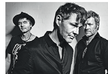
Zeitlos frische Synthpop-Legenden aus Norwegen: Nicht nur der A-ha-Hit «Take on Me» von 1984 ist ein Elektro-Klassiker. (1.7.2022)

Schon der Atmosphäre wegen lohnt sich die Fahrt in die südwestliche Traumsee-Ecke der Schweiz. Wie haben wir das vermisst!