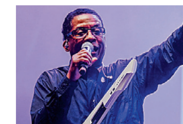
Er liebt Montreux, und das Publikum liebt ihn: Innovativ-Jazzler Herbie Hancock darf als Stammgast auch 2022 nicht fehlen. (16.7.2022)